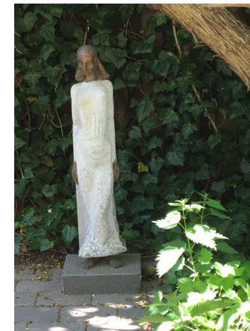
Jens-Peter Kellermann. "August-marmor". Bronze og marmor. Højde: 30 cm.

Fernisering lørdag den 6. november 2021 kl. 14-16