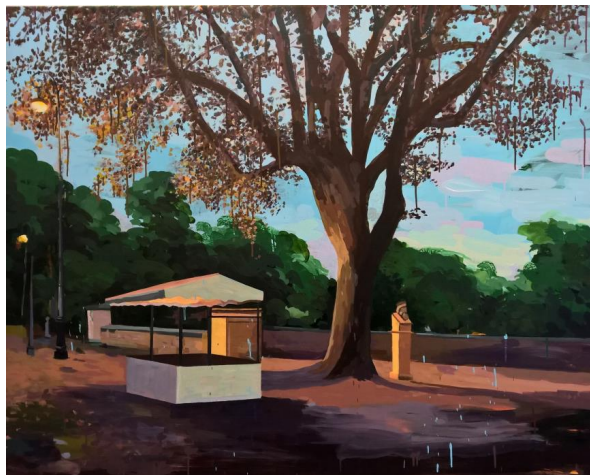
Anita Viola Nielsen. "Evening in Villa Borghese". 2016. Akryl på lærred. 120 x 150 cm.